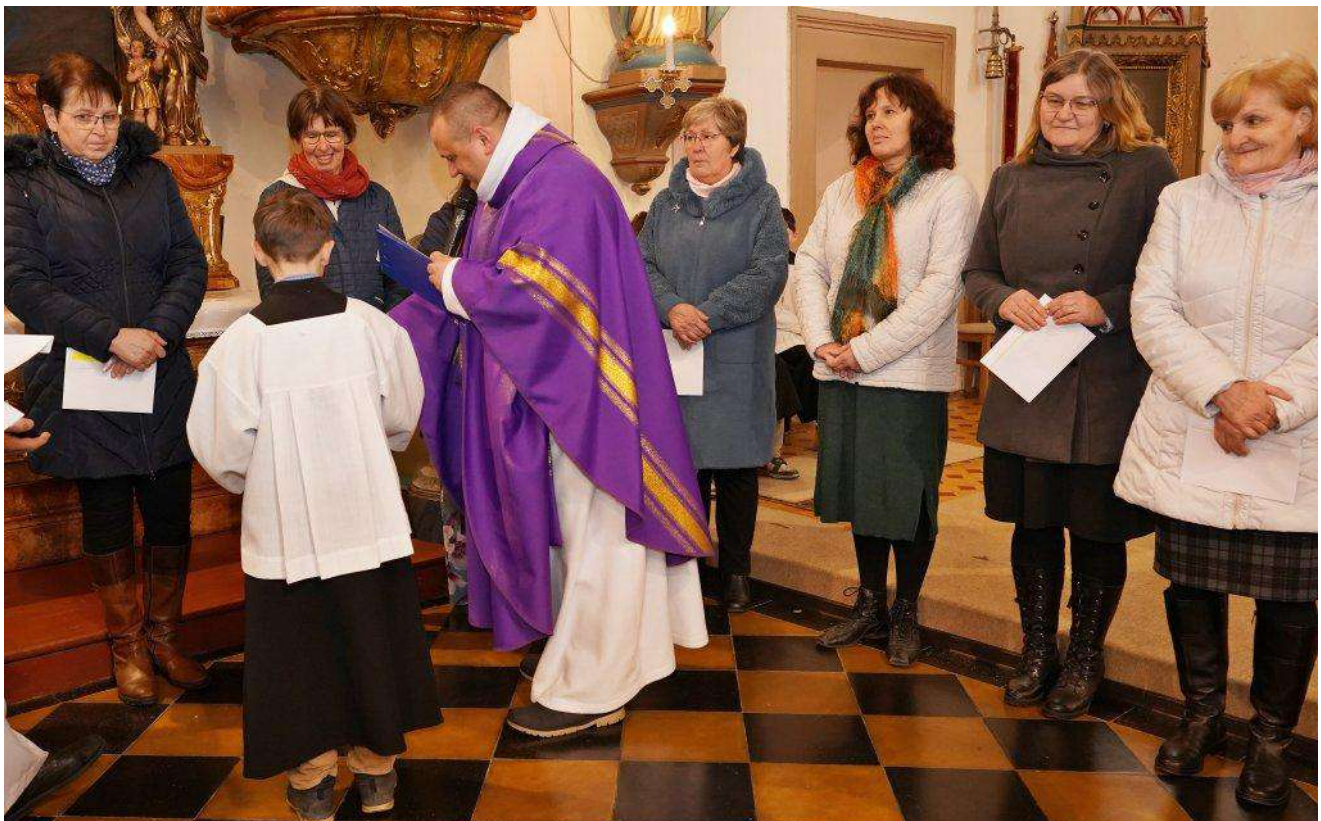
Představení a ustanovení nové pastorační rady farnosti na závěr mše v neděli 1. 3. 2026 v DČ 😊